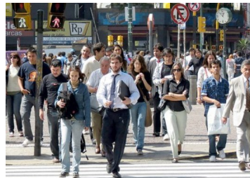
Lo bueno y lo malo de la nueva Ley de Quiebras: expertos difieren sobre los beneficios de la modificación que comienza a reqir este viernes | Diario