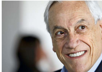
El nuevo aire de Sebastián Piñera | Diario Financiero