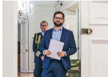
La reflexión de Boric y el caso Convenios: "Los que sufren con los sinvergüenzas que han aparecido en nuestro gobierno son las personas y