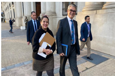
La “teoría del queso suizo” con la que Dipres explicó lo sucedido en los traspasos de fondos de los Gobiernos Regionales | Diario Financiero