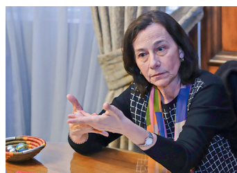
Costa y mayores requerimientos de capital a la banca: "Enfrentamos tiempos inciertos (...) Lo que responsablemente nos corresponde es