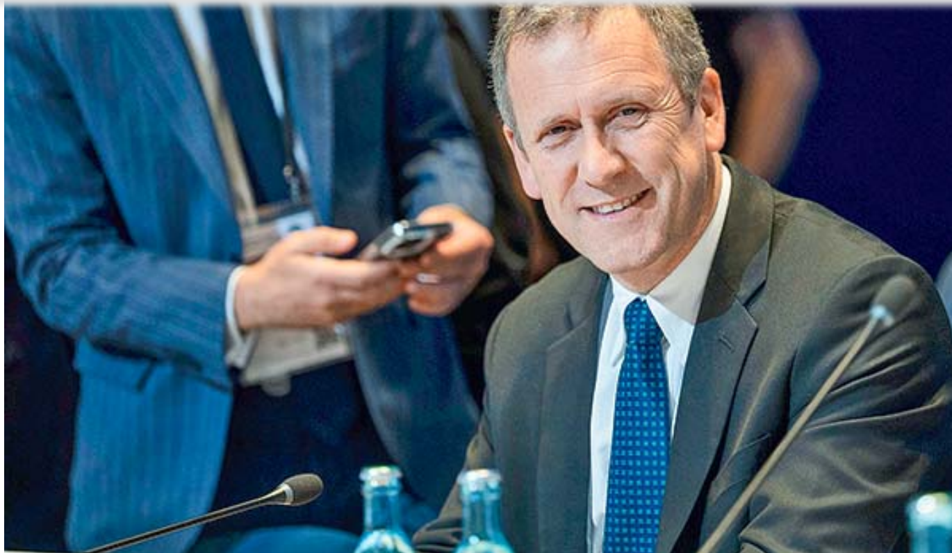
Juan Carlos Muñoz, ministro de Transportes y Telecomunicaciones.