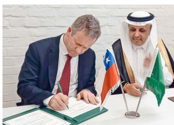
Ministerio de Transportes y Arabia Saudita firman acuerdo de servicios aéreos que permitirá el tráfico de pasajeros y carga entre ambos países | Diario