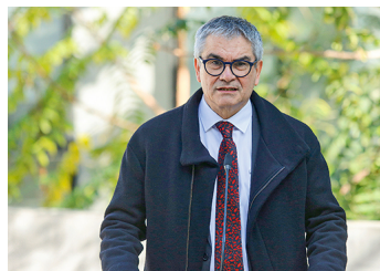
Reforma tributaria: republicanos preparan propuesta e impuesto al