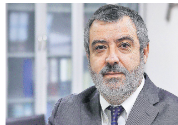
Fonasa: entrada de usuarios desde sector privado dejaría margen positivo para el Estado | Diario Financiero