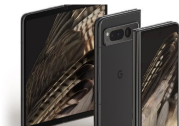
Google entra a competir al mercado de teléfonos plegables con su primer modelo Pixel por US$ 1.800 | Diario Financiero