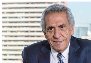
La carta del presidente de Global, la complicada financiera automatizada que se enfrentará a sus bonistas el 24 de mayo | Diario Financiero