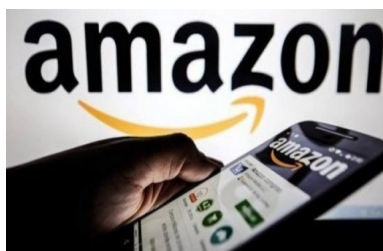
Amazon se sube a la moda de los "chatbots" y planea integrar Inteligencia Artificial en sus motores de búsquedas | Diario Financiero