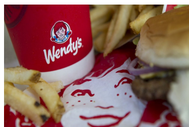
Wendy's recurre a un chatbot de IA para que atienda a sus clientes a través del "drive thru" | Diario Financiero