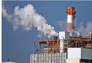
AES Andes evalúa acciones legales para impugnar primera medida ejecutada de la agenda inicial para la transición energética presentada por el Gobierno |