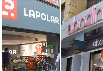
Fusión encumbraría a La Polar Abcdin como segunda cadena con más multitiendas en Chile | Diario Financiero