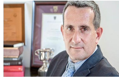
Presidente de la Cámara Chileno Canadiense de Comercio: “La sociedad chilena manifestó que no está de acuerdo con un proceso transformacional