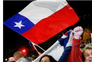
Así reaccionaron los medios internacionales ante los resultados electorales en Chile | Diario Financiero