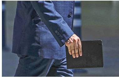
Sombría mirada se instala entre head hunters del país: mayoría cree que empeorará el desempleo | Diario Financiero