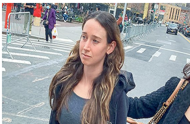
Fundadora de startup Frank acusada de estafar a JPMorgan | Diario Financiero