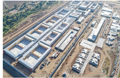
Fisco de Chile lanza duros cuestionamientos a millonaria demanda de Acciona | Diario Financiero