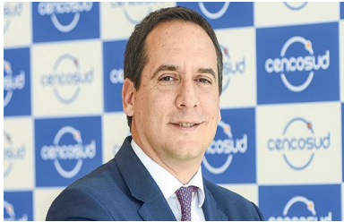
CEO de Cencosud vende acciones de la compañía para “diversificar sus inversiones” | Diario Financiero