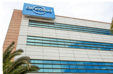
Otro cambio en Cencosud: renuncia gerente Corporativo de Auditoría, Riesgos y Control Interno | Diario Financiero