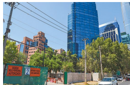
El millonario y desconocido pago del fisco a Copec por expropiación para futura Estación Isidora Goyenechea del Metro | Diario Financiero