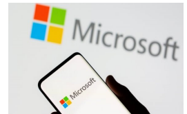
La apuesta de Microsoft en el desarrollador ChatGPT marca una nueva era de IA | Diario Financiero