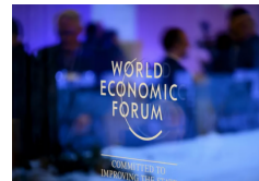
Davos: Así será la tormenta económica, según los 4.000 directivos más relevantes | Diario Financiero