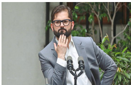
Indultos: la salida que vislumbra La Moneda a una crisis de dos semanas que no termina | Diario Financiero