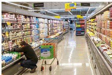
Justicia declara ilegales y deja sin efecto los contratos multifuncionales de Walmart Chile | Diario Financiero