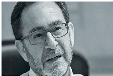
Crisis de la construcción: Contraloría autoriza al MOP a reajustar contratos de obras públicas vigentes | Diario Financiero