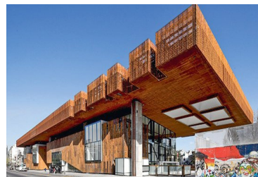
Justicia decreta la quiebra de constructora Claro, Vicuña, Valenzuela: bienes deben ser puestos a disposición de la liquidadora | Diario