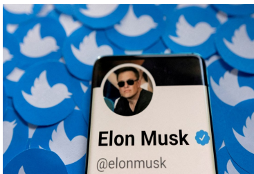
Elon Musk advierte sobre el riesgo de una eventual bancarrota de Twitter | Diario Financiero