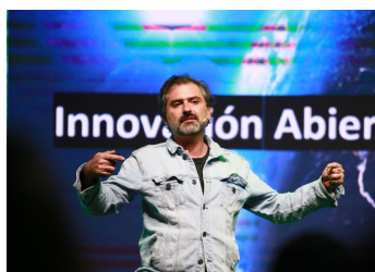
La nueva Red de Innovación que busca impulsar la sostenibilidad desde el mundo privado | Diario Financiero