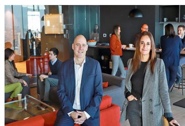
Prieto Abogados cambia de era: deja oficinas en El Golf y reformula modelo de trabajo | Diario Financiero