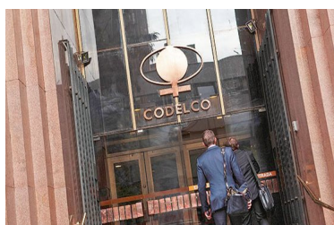
Codelco autoriza la construcción de desalinizadora para sus faenas del norte con una inversión de US$ 1.000 millones | Diario Financiero