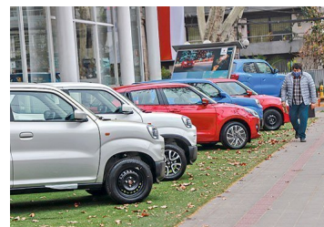
Industria automotriz proyecta la cantidad de autos nuevos que se venderán este año | Diario Financiero