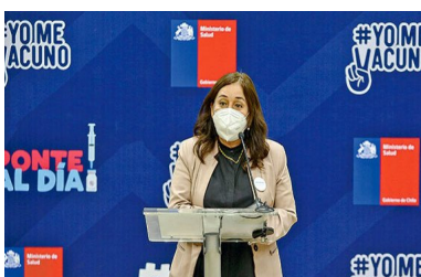
Reforma a la salud parte con anuncio de proyecto para crear un fondo universal | Diario Financiero