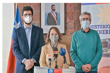
Gobierno: caída de la licitación limpia la discusión con eventuales socios estratégicos en la Empresa Nacional del Litio | Diario Financiero