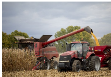
El precio de los alimentos baja en mayo, pero sube el cereal debido a guerra | Diario Financiero