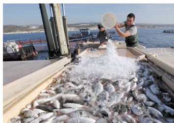
Pescadores artesanales de Coquimbo buscan anular permiso medioambiental de proyecto que moderniza puerto de la zona