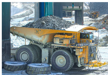
Anglo American prevé producción de hasta 600 mil toneladas sujeto al Covid-19 y la disponibilidad de agua