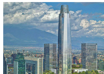
Cencosud obtiene luz verde de la autoridad ambiental para transformar el Costanera Center