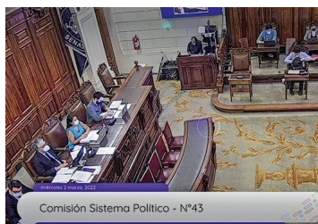
Toma forma Congreso Plurinacional: diputados desde 18 años y una reelección