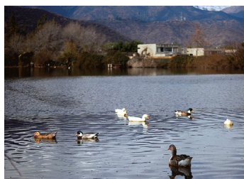
Segundo Tribunal Ambiental confirma freno a obras inmobiliarias en