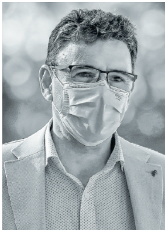
Maisa Rojas, ministra del Medio Ambiente. Flavio Salazar, titular de Ciencia.