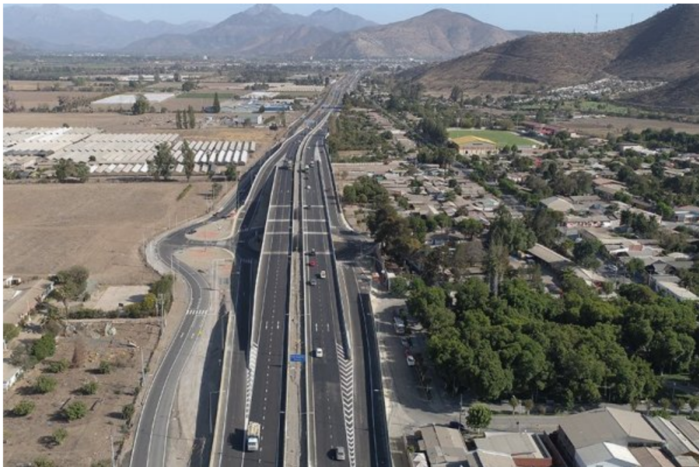
Vista de la concesión vial Ruta Nogales-Puchuncaví.

Por: Claudia Saravia | Publicado: Martes 30 de noviembre de 2021 a las 17:30 hrs.