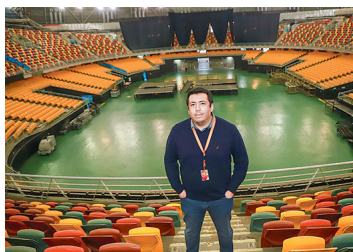
Operador del Movistar Arena crea una línea de negocios para compensar