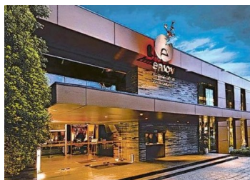
Proyecto de Enjoy en Pucón se anota triunfo: TC desestima reclamo de