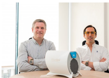
Bluetek lanzará línea de purificadores de aire "made in Chile" para el hogar y se instalará en EEUU