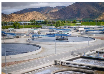
Sanitarias bajaron nivel de cumplimiento de planes de