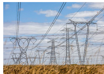
Conflicto en valorización de activos y otros riesgos