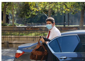
Mercado ratifica proyección de menor PIB, más inflación y alto déficit fiscal en 2022