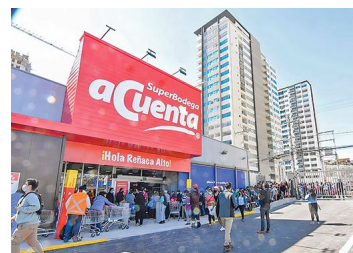
Walmart reabre dos supermercados afectados en estallido social y suma casi 70 locales recuperados