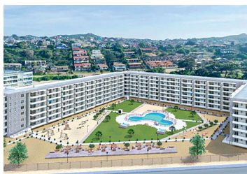
Nuevo proyecto inmobiliario en Los Molles por US$ 21 millones