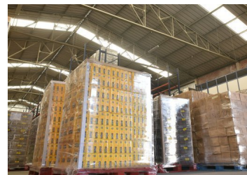
Baja vacancia histórica en mercado de bodegas acelera proyectos para próximos dos años y se expande a nuevos polos