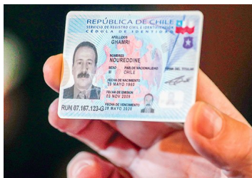
Licitación de pasaportes: actual operadora pide suspender proceso a un mes de la adjudicación