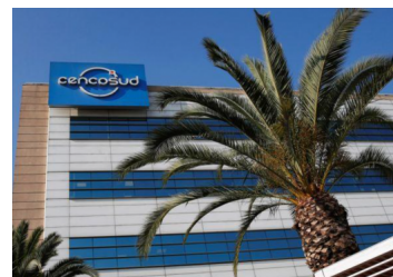
Cencosud presentó la apertura a bolsa de su unidad en Brasil