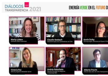
Qué desafíos presenta Chile en energía sustentable