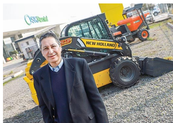
Filial de Sigdo Koppers lanza marketplace de venta de maquinaria usada en pleno repunte del negocio