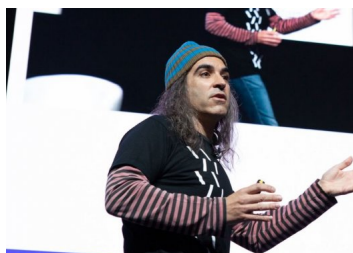
Hacker internacional y la "sensibilidad" de las bases de datos de las marcas y el ecommerce