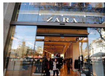
Presidente de Inditex, controlador de Zara, asegura que el 98% de las tiendas del grupo ya están abiertas