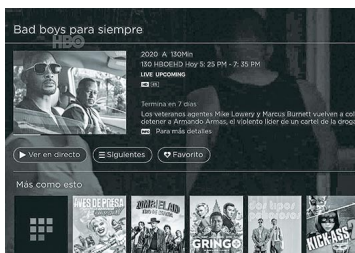
WOM se prepara para desplegar oferta de televisión de pago con pilotos en la Región Metropolitana