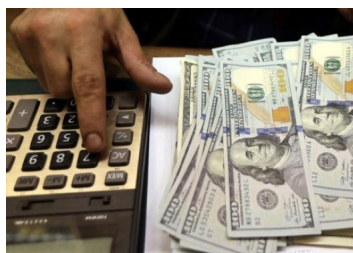
El dólar en Chile cae tras anuncio de Hacienda de nuevas emisiones de deuda en moneda extranjera