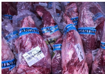
Argentina planea reabrir la exportación de carne vacuna la semana próxima