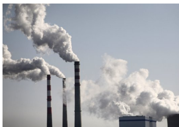
Los calificadores de las credenciales ecológicas de las empresas necesitan más supervisión, según organismo británico