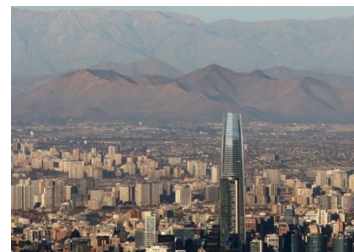
Santiago se convierte en la ciudad más cara de Sudamérica para ejecutivos extranjeros