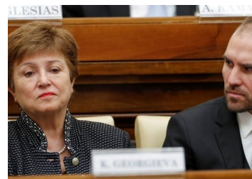
El FMI ya habría descartado firmar un acuerdo con Argentina para este año