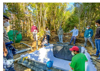
Proyectos pilotos de "construcción" de