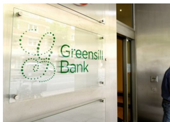
Inminente quiebra de Greensill Capital provocaría ola de impagos y destruiría hasta 50 mil empleos