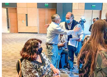
Las propuestas de los grandes empresarios para