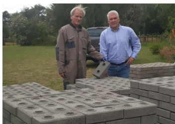
Emprendedores crean ladrillos a partir de cenizas volcánicas del sur de Chile