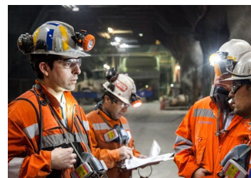
Sector minero registra el mayor nivel de empleo en nueve meses con 202 mil puestos de trabajo