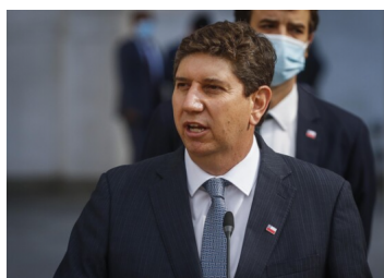
Ministro Cerda asegura que la nueva Constitución atraerá inversiones estables