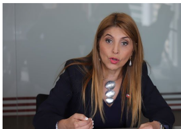
Subtel recibe ofertas de tres empresas para desarrollo de