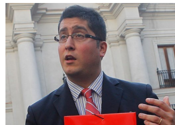
Felices y Forrados anuncia el cierre tras aprobación de