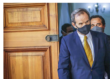
Allamand: no hay "una opinión positiva" del proyecto que busca normar compra de empresas estratégicas