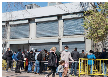
Cámara declara admisible el tercer retiro de fondos de