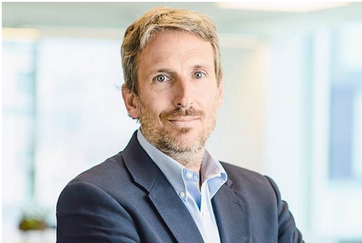
Patricio Rey Desarrollo País.

Originalmente, se había planificado que la inversión fuese entre Chile, Argentina y Brasil, con una menor participación de privados. Nuestro país sería dueño del 51% de la red, mientras que se negociaba la entrada de los otros Estados. Pero la lentitud de estas conversaciones y la propagación de la pandemia, llevó a que el gobierno evaluara otras alternativas, hasta que Desarrollo País definió que era necesario contar con un socio estratégico que se encargara de la “preventa” del cable.