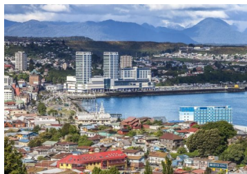
El sector turístico chileno enfrenta su verano más sombrío