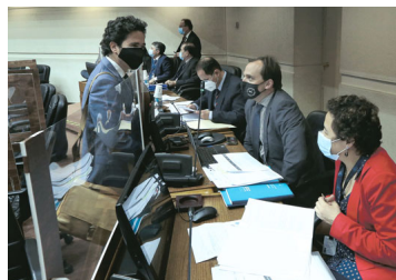
Reajuste del sector público irá al Congreso la próxima semana