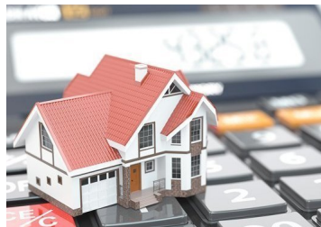
Recaudación por impuesto territorial empiezan a mostrar signos de recuperación en el tercer trimestre