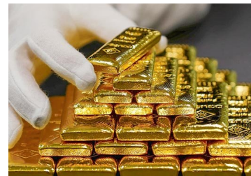
Crece el interés por el oro: autoridad da luz verde a dos nuevos fondos para que las AFP puedan invertir