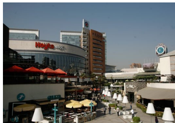
Parque Arauco repunta tras avance de vacuna contra el Covid-19