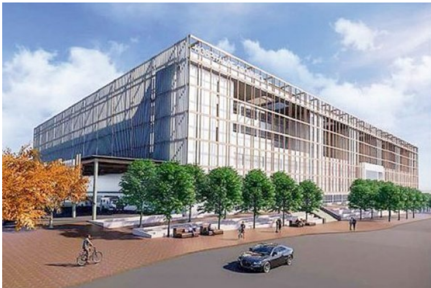
Así lucirá el proyecto del nuevo Hospital de Coquimbo.

Por: Valentina Osorio | Publicado: Viernes 9 de octubre de 2020 a las 04:00 hrs.