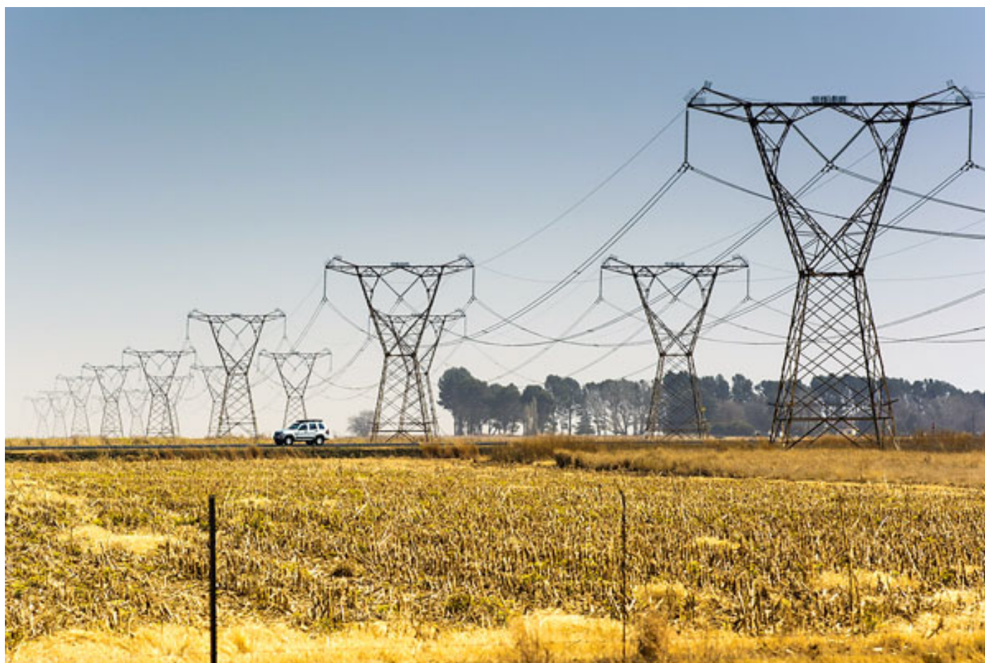
La línea tendrá 1.500 kilómetros de extensión.

Por: Karen Peña | Publicado: Miércoles 28 de octubre de 2020 a las 04:00 hrs.