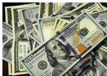
Dólar parte el día sobre los $ 790 siguiendo tendencia global