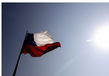
Desplome histórico este año pero fuerte repunte en 2021: las claves del IPoM