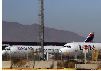
Bethia reconoce a la CMF que estudiará posibilidad de aportar recursos a Latam