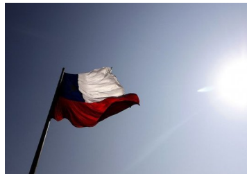
Desplome histórico este año pero fuerte repunte en 2021: las claves del IPoM más pesimista del Banco Central