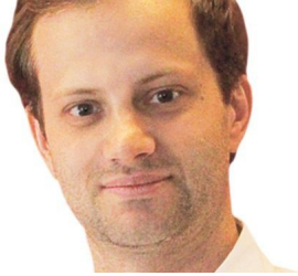
Opinión - Columnistas - Axel Kaiser - Diario Financiero