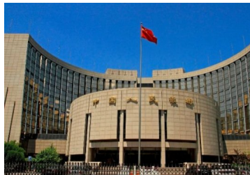
China aumentará flexibilización monetaria para apoyar economía