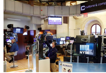
Estímulos internacionales impulsan a Wall Street