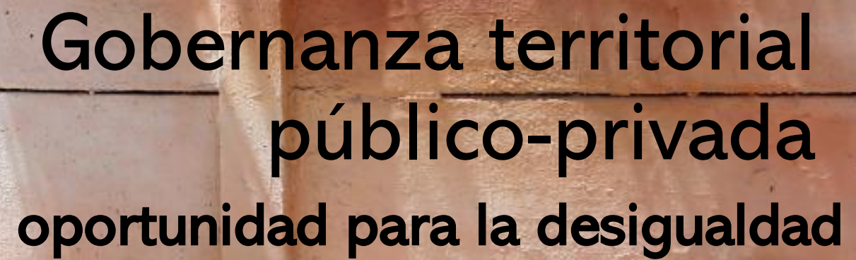
Foto: Mural “Memorias Renquinas, un relato a color”, obra de Daniel Vargas