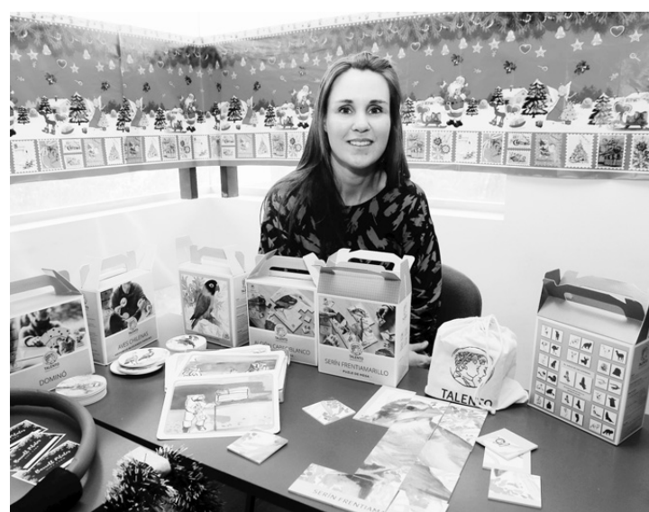
Este programa busca entregar distintas herramientas tecnológicas a las mipymes para que puedan mejorar la gestión y productividad.

Post pandemia, Sutil estimó que es clave que el país avance en soluciones de infraestructura para la crisis hídrica y de conectividad digital, única manera de reducir las brechas que hoy existen. Graficó, señalando que aún hay localidades que no tienen acceso a agua potable y que de los APR -que son la solución que hasta ahora se les ha dado- sólo el 30% funciona.