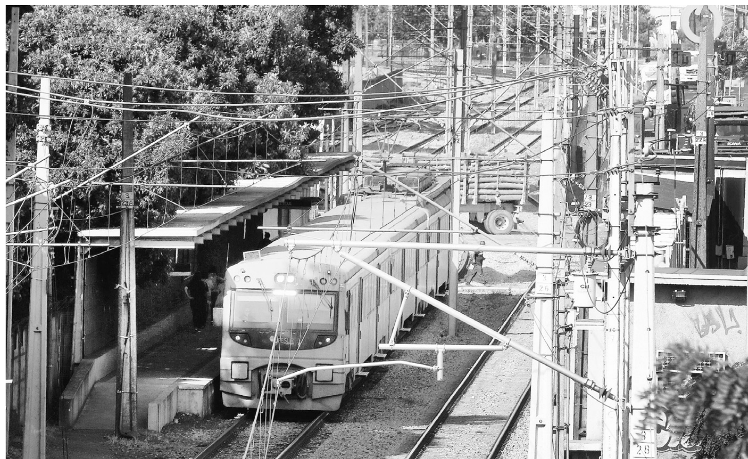
Entre las obras que se deben privilegiar más mencionadas fueron la construcción de hospitales (46%); obras de riego (39,3%); conectividad digital (38,7%); trenes de cercanía (30,7%) y grandes obras viales (28,2%).

Profundizando en el tema empleo, Cruz agregó que para generar más puestos de trabajo el MOP, Mívu y los municipios deben