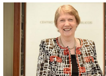
Helen Clark en el CEP: "Chile está atrapado en una tormenta perfecta"