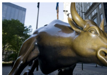
Lo que debes saber este viernes antes que abra el mercado