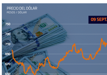
Dólar revierte tendencia y termina la jornada al filo de