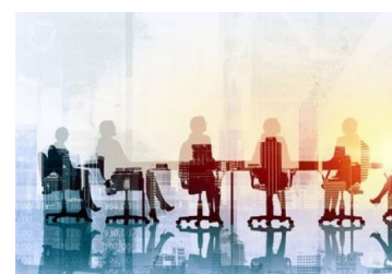
The Legal 500 analiza el mercado chileno y rankea a