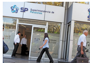
Superintendencia de Pensiones oficialará a AFP Habitat por publicidad sobre destino del 4% de cotización adicional