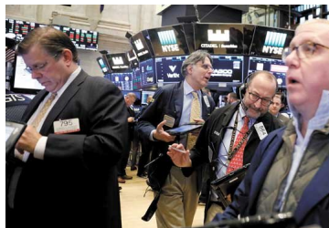
Peso argentino se desploma 25% y llega a su menor valor en la historia tras derrota de Macri en las primarias