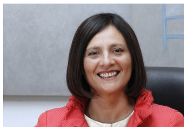
Exministra Loreto Silva ingresa al directorio de Barrick Gold