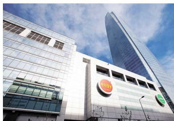
Acciones chilenas expuestas a Argentina lo pasan pésimo en la Bolsa de Comercio de Santiago