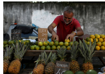
BID advierte que economía de Latinoamérica podría contraerse si escala tensión comercial