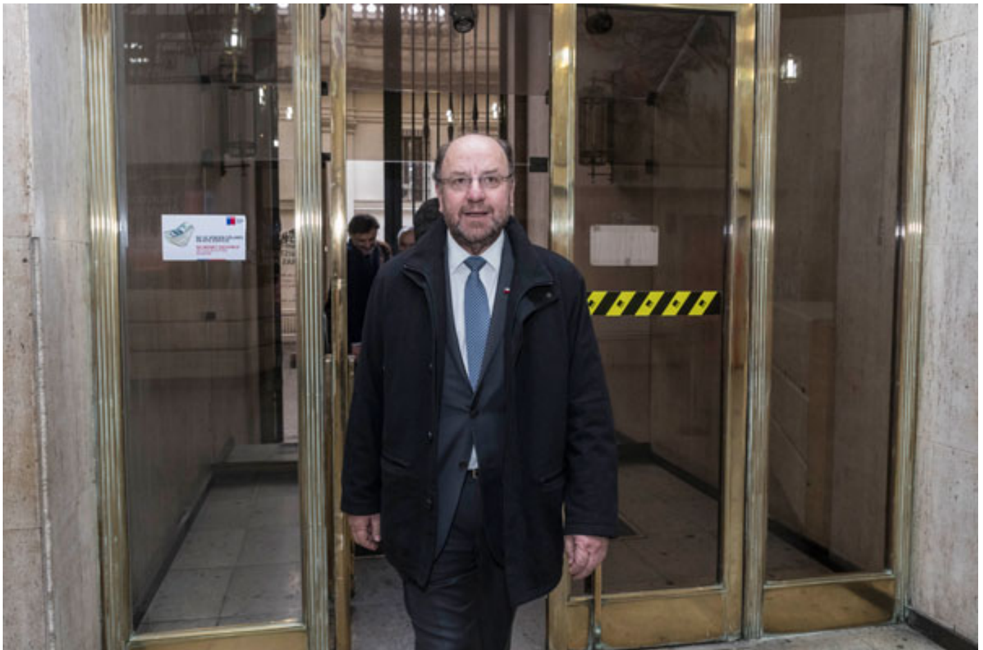
Ministro Alfredo Moreno, titular del MOP.

Por: Jorge Isla | Publicado: Jueves 18 de julio de 2019 a las 04:00 hrs.