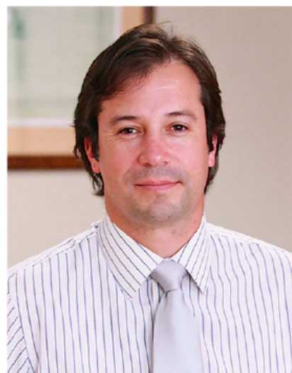
Lucas Palacios Ministro (s) de Obras Públicas

Todo lo anterior busca generar las condiciones para lograr un fast track que permita acelerar obras en curso más proyectos futuros por un total de US$ 1.082 millones, cuyo inicio está previsto para este año y 2020.