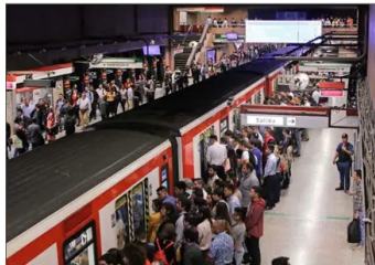
AFLUENCIA — La red de metro aumentó en un 21% la cantidad de pasajeros transportados. En el caso de la Línea 1, esta creció en un 20%.

En el caso de los buses, el sistema operó con un 25% más de la flota que tiene en época estival y transportó ayer a más de 850 mil personas en la mañana.