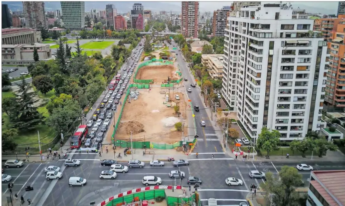
ARTERIA PRINCIPAL — Américo Vespucio es uno de los puntos vigilados. En la avenida se desarrollan obras para la construcción de la autopista Américo Vespucio Oriente (AVO), y ayer se registró una leve alza en el tráfico vehicular.

La ministra de Transportes, Gloria Hutt, afirmó que en el caso de obras como AVO, hay situaciones que se extenderán, ya que “son de larga duración y van por tramos”.